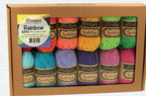
Softfun Minis Colour Pack 'Rainbow' (60% Katoen, 40% Acryl; 12 x 20 gr/56 m)